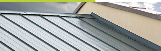
1 Toiture en bac acier