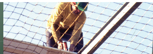
3 Filets de recueil

Pour un accompagnement personnalisé ou pour plus d'informations :